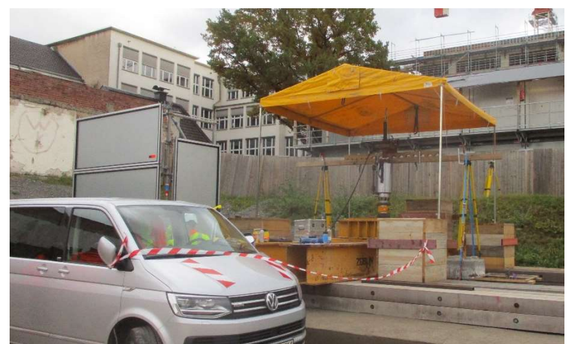
Versuchsaufbau mit Lastverteilung, Prüffahrzeug und Prüfpresse

Die dabei erhobenen Messdaten werden nun durch einen Baugrundgutachter bewertet und anschließend dem Ingenieurbüro zur weiteren Planung der Auftriebsanker der späteren Unterwasserbetonsohle übergeben.