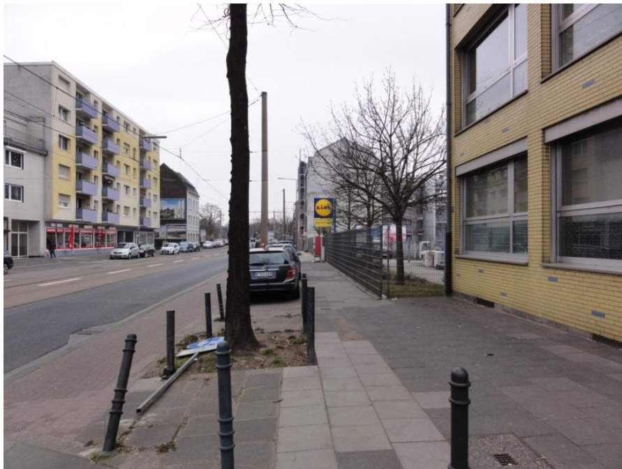
Abbildung 7: Neusser Straße mit Blick Richtung Norden

Das Stadtbild im Bereich der Neusser Straße wird v.a. durch Blockrandbebauung mit hohem Versiegelungsgrad charakterisiert. Die Bebauung zeichnet sich durch heterogene Baustrukturen und Bauhöhen aus.