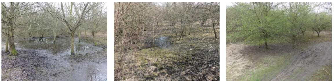
Abbildung 4: Temporärgewässer im geschützten Landschaftsbestandteil „Brache zwischen Neusser Straße und Simonskaul, Weidenpesch“ am 05.03, 25.03. und 17.04.2013