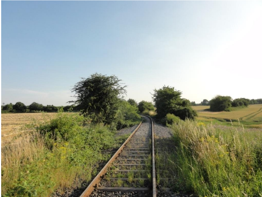
Abbildung 16: Vorhandene Zulaufstrecke innerhalb der landwirtschaftlich genutzten Freiflächen südlich Simonskaul mit Blick Richtung Süden