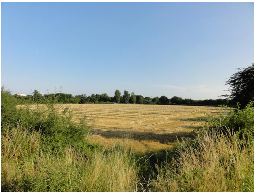
Abbildung 15: Landwirtschaftlich genutzte Freiflächen westlich Zulaufstrecke mit Blick Richtung NW

Einen deutlichen Kontrast zu den dicht bebauten Siedlungsflächen bilden die im Nordosten des Untersuchungsraumes vorhandenen landwirtschaftlich genutzten Offenlandbereiche (Abbildung 15, Abbildung 16). Hervorzuheben sind die zahlreichen gliedernden Gehölzstrukturen z.B. entlang der Zulaufstrecke.