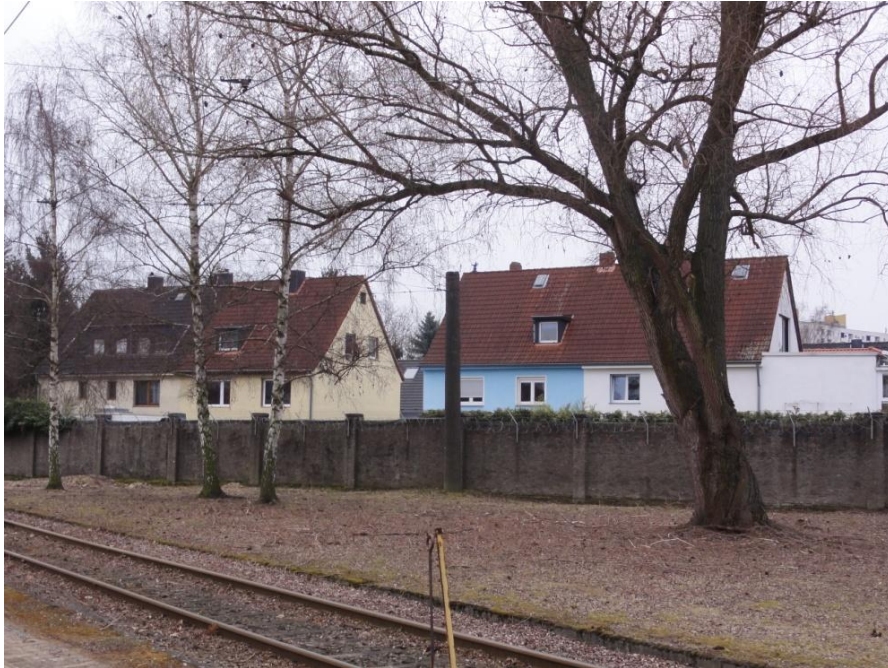
Abbildung 14: Wohnbebauung südlich der Hauptwerkstatt Weidenpesch

Einen deutlichen Kontrast zu den dicht bebauten Siedlungsflächen bilden die im Nordosten des Untersuchungsraumes vorhandenen landwirtschaftlich genutzten Offenlandbereiche (Abbildung 15, Abbildung 16). Hervorzuheben sind die zahlreichen gliedernden Gehölzstrukturen z.B. entlang der Zulaufstrecke.