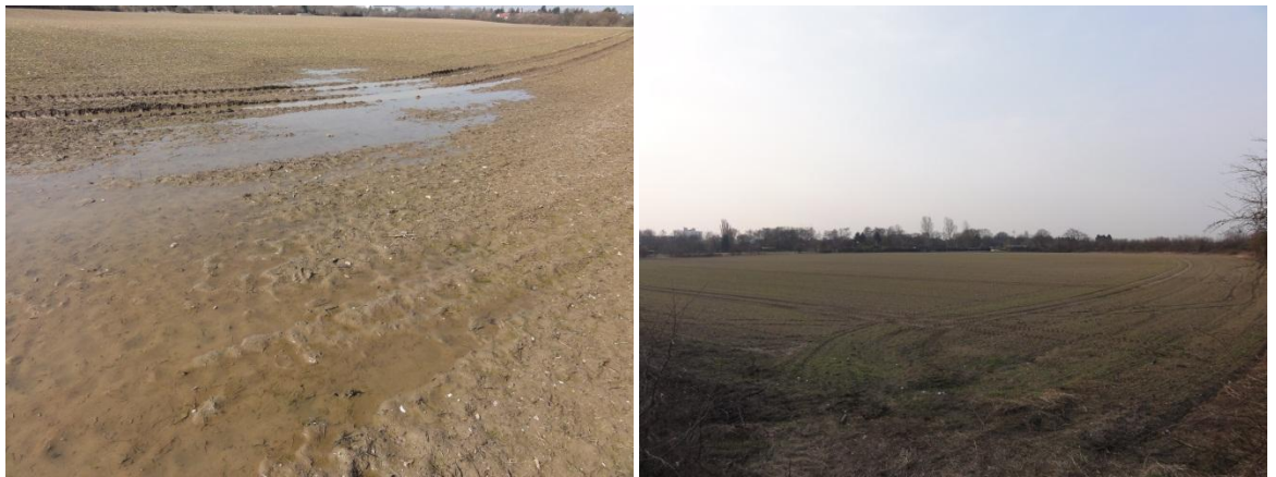
Abbildung 3: Temporärgewässer auf Ackerfläche westlich der Zulaufstrecke am 25.03 und 28.03.2013

2013 nur eine kurzzeitige - wenige Tage anhaltende - Wasserführung festgestellt. Als Amphibienlaichhabitate haben die beiden Temporärgewässer keine Bedeutung.