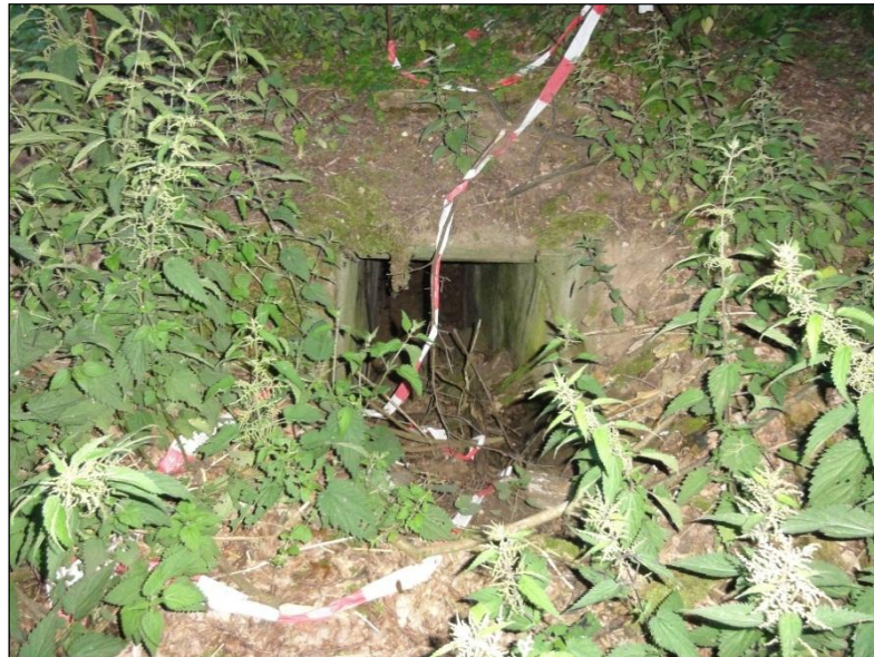
Abbildung 6: Bunkereingang (ca. 0,7 x 0,7 m) auf dem nördlichen Hauptwerkstattgelände

Im Zuge von Rückschnittsarbeiten wurde der Eingang eines Bunkers auf dem Hauptwerkstattgelände freigelegt (s. Abbildung 6). An einer freigelegten Öffnung des Bunkers erfolgte zwei Ausflugkontrollen. Die Untersuchungen wurden ca. 15 Minuten vor Sonnenuntergang begonnen und endeten etwa 30 Minuten nach dem Einsetzen völliger Dunkelheit.