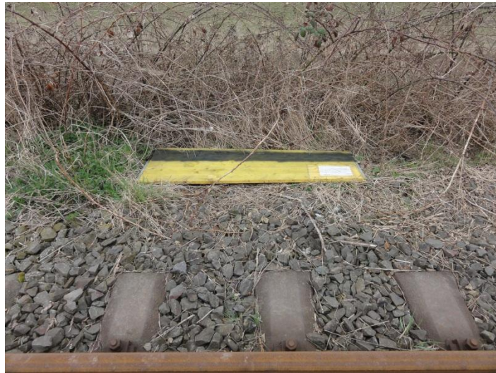
Abbildung 2: Schlangenbrett in einem sonnenexponierten Randbereich der Zulaufstrecke

Bei den Untersuchungen wurde insbesondere auf sonnenbadende Tiere geachtet. Darüber hinaus wurden gezielt mögliche Versteckplätze wie Steine, Astwerk und sonstige Deckung gebende Gegenstände angehoben und auf sich darunter versteckende Reptilien überprüft. Ergänzend wurden zusätzliche Versteckplätze in Form von fünf Schlangenbrettern (Schalttafel) sowie 15 Dachpappen in potenziellen Reptilienhabitaten ausgelegt und regelmäßig bei günstiger Witterung und Tageszeit kontrolliert (vgl. Abbildung 2).