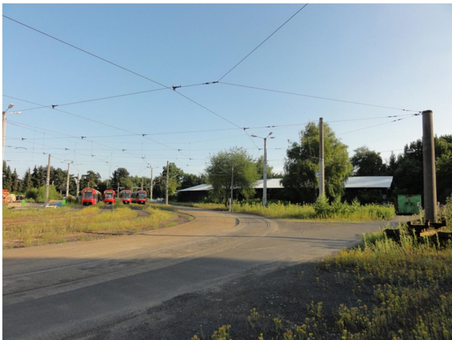
Abbildung 13: Gelände der Hauptwerkstatt Weidenpesch, Westseite

Das Gelände der Hauptwerkstatt Weidenpesch wird durch die Gebäude und Hallen der Werkstatt sowie einem relativ hohen Gehölzflächenanteil insbesondere in den Randbereichen gekennzeichnet (Abbildung 12, Abbildung 13).