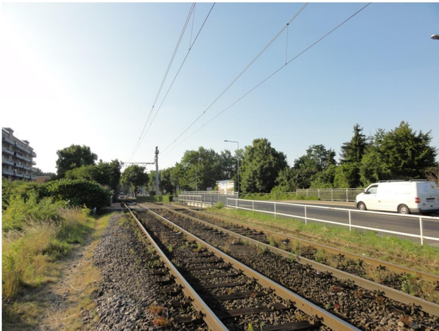
Abbildung 9: Neusser Straße unmittelbar vor der Brücke über die HGK-Trasse mit Blick Richtung Longerich