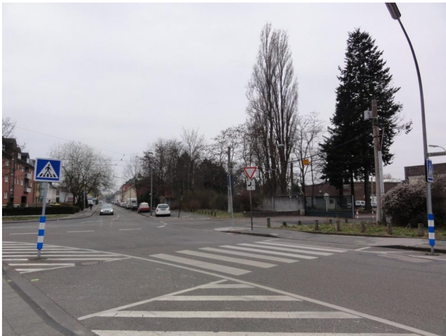
Abbildung 11: Simonskaul mit Zufahrt Hauptwerkstatt Weidenpesch (rechts)

Westlich der Neusser Straße im Bereich der Straße Simonskaul verringert sich die Bauhöhe der Gebäude und eine deutliche Zunahme der Grünflächen (z.B. Gärten, Vorgärten, Grünanlagen) ist festzustellen.