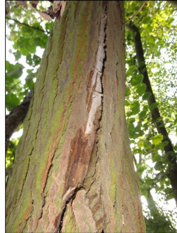
Abbildung 5: Baume mit Spechtlöcher und Rinderspalten im Untersuchungsraum

Im Zuge von Rückschnittsarbeiten wurde der Eingang eines Bunkers auf dem Hauptwerkstattgelände freigelegt (s. Abbildung 6). An einer freigelegten Öffnung des Bunkers erfolgte zwei Ausflugkontrollen. Die Untersuchungen wurden ca. 15 Minuten vor Sonnenuntergang begonnen und endeten etwa 30 Minuten nach dem Einsetzen völliger Dunkelheit.