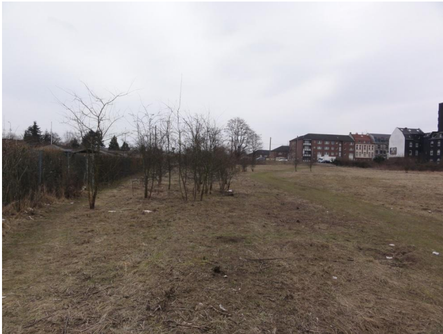
Abbildung 10: Blick aus Westen vom geschützten Landschaftsbestandteil zur Neusser Straße

Westlich der Neusser Straße im Bereich der Straße Simonskaul verringert sich die Bauhöhe der Gebäude und eine deutliche Zunahme der Grünflächen (z.B. Gärten, Vorgärten, Grünanlagen) ist festzustellen.