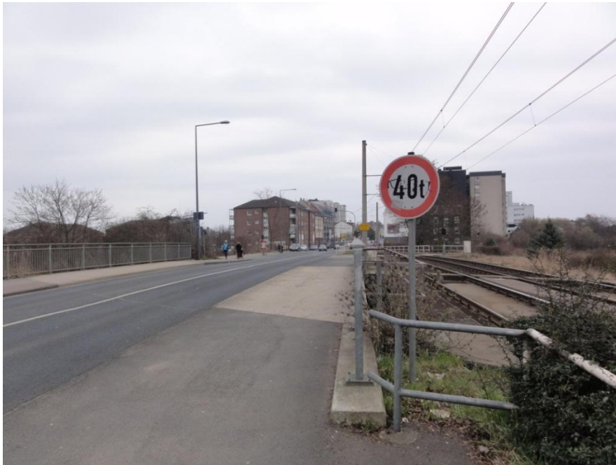
Abbildung 8: Neusser Straße an der Brücke über die HGK-Gleise mit Blick Richtung Süden