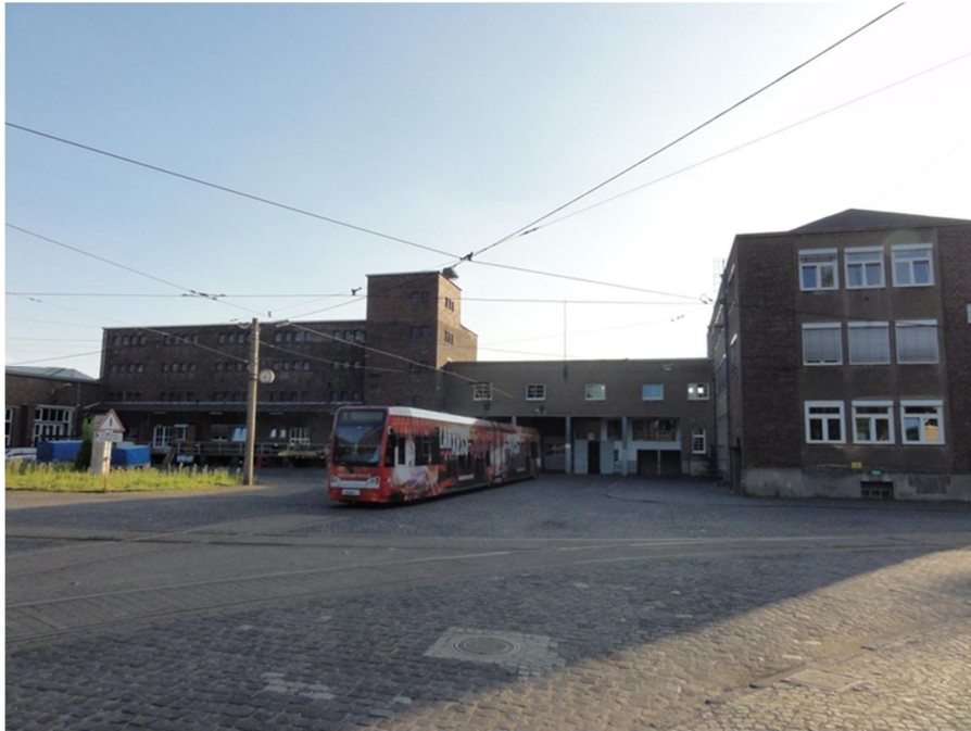
Abbildung 12: Hauptwerkstatt Weidenpesch, Ostseite

Das Gelände der Hauptwerkstatt Weidenpesch wird durch die Gebäude und Hallen der Werkstatt sowie einem relativ hohen Gehölzflächenanteil insbesondere in den Randbereichen gekennzeichnet (Abbildung 12, Abbildung 13).